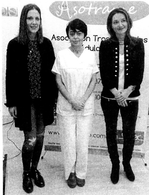
Tres expertas defienden los beneficios del yoga

Por otra parte, ayer dio comienzo en el Chuac un curso sobre abordaje de personas con proble-