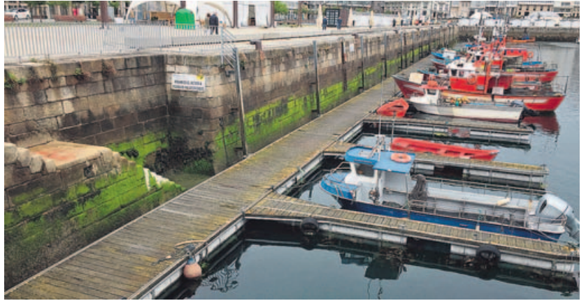
Imagen del estado del pantalán flotante de la dársena de la Marina. MARCOS MÍGUEZ

El sector de bajura también protesta por la falta de manteni-