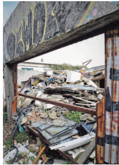
Vertedoiro xunto á torre de Hércules. GERMÁN BARREIROS

O peor de todo é que non saibamos por que non