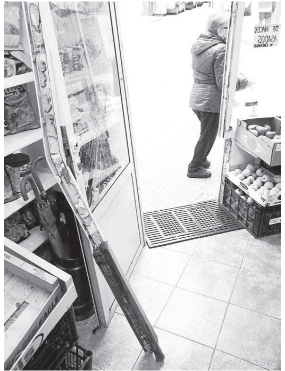
La tienda de alimentación mostraba ayer las señales del robo | QUINTANA

Más recientemente, el barrio de Agra do Orzán también sufrió un robo de una lavandería automática a plena luz del día, y que se frustró porque uno de los testigos del delito persiguió y alcanzó al sospechoso cuando ya se encontraba en la ronda de Outeiro, a punto de tomar un taxi. ●