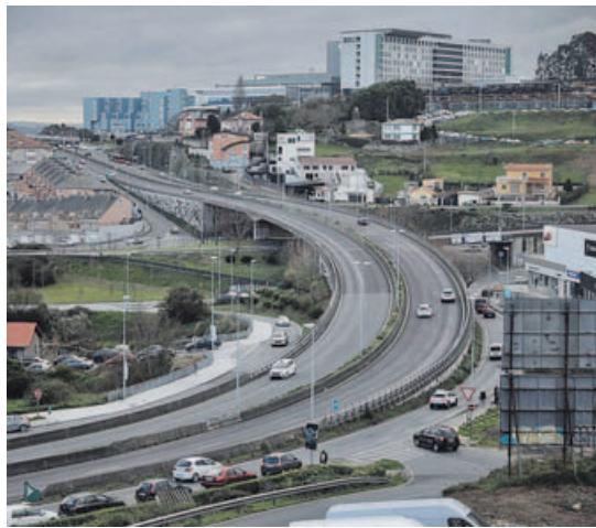
La avenida de A Pasaxe, con el Chuac al fondo.

Además, recordó que la Xunta está trabajando para que la nueva intermodal se pueda licitar en ocho meses, reclamó al Gobierno central que ponga en marcha el dragado de la ría de O Burgo, y añadió que la Xunta es la única