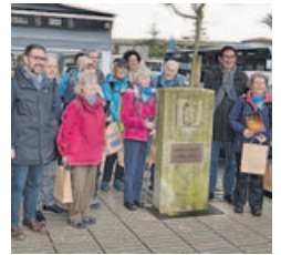
El grupo antes de comenzar.

Además de los fármacos de la diabetes, alude también al uso de estatinas o fibratos. «Es como en el infarto: tienes que tratarle la angina aguda, el dolor, pero también bajarle el colesterol, la tensión, la glucosa... para que no se vuelva a repetir», dice Blanco sobre el abordaje de lo que ya se ha bautizado, en un símil con la arterioesclerosis de las arterias, artiesclerosis (por articularidad metabólica) y que presenta, junto a terapias ya conocidas, el Inibic trabaja en el desarrollo de proyectos en común con los grupos internacionales invitados al simposio de ayer para buscar nuevas dianas terapéuticas que corrijan las disfunciones en la mitocondria en pacientes con artrosis metabólica.