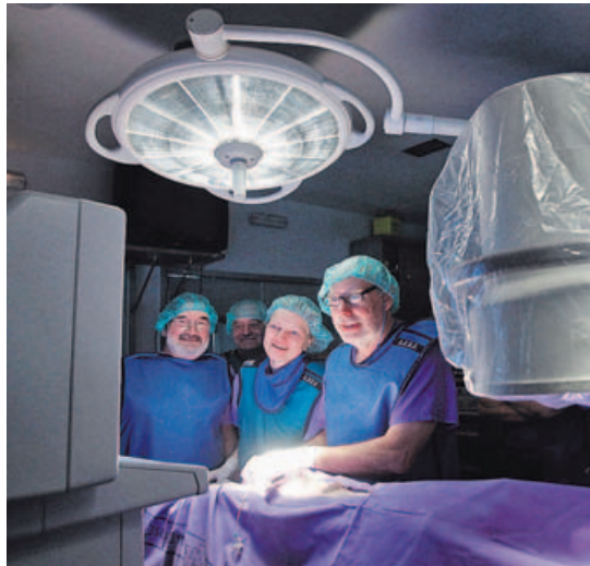
Prácticas en el Centro Tecnolóxico de Formación del Chuac actual. a. r.

Aunque alojará servicios de docencia, formación e investigación del área sanitaria, su funcionamiento y actividad se desarrollará mayoritariamente por los profesionales del Sergas, conjun-