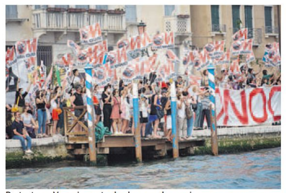
Protesta en Venecia contra los buques de pasajeros.

Ayer la industria ha retomado la actividad y la embarcación MSC Orchestra ha partido desde Venecia.