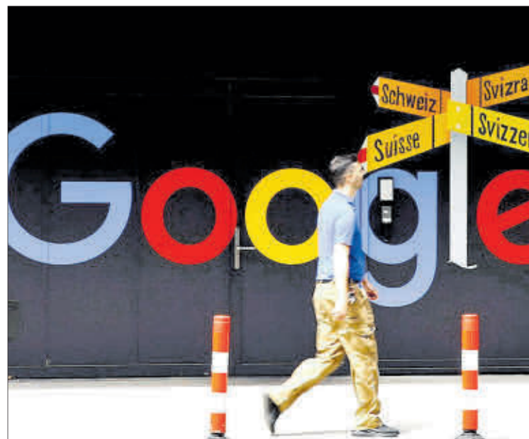
Un hombre, frente a un logotipo de Google, en un edificio de Zúrich.

El conflicto entre Google y los editores de prensa francesa se remonta a finales de 2019, cuando las agencias de prensa y los editores galos recurrieron a la Autoridad de la Competencia al estimar que el gigante estadounidense se beneficia-